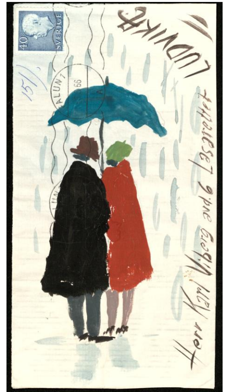
Arkiv: Nils och Astrid Klarqvists arkiv (FAW/ 9.2020, serie F1b).

När arbetet med migreringen är klart kommer alla arkiv vara sökbara och då mer tillgängliga för forskning.